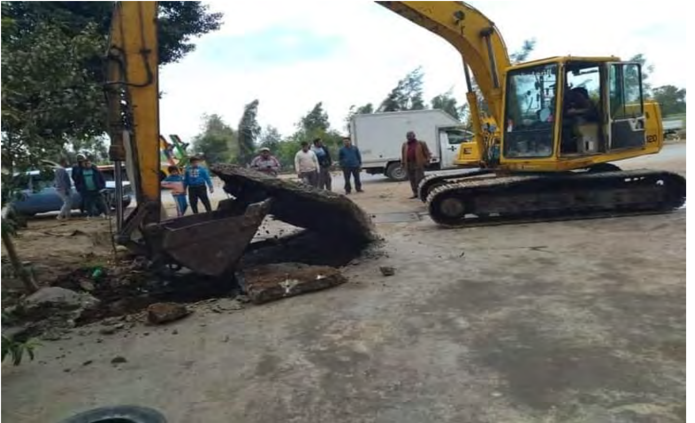
قطاع المتغيرات المكانية لرئاسة مركز ومدينة المنصورة