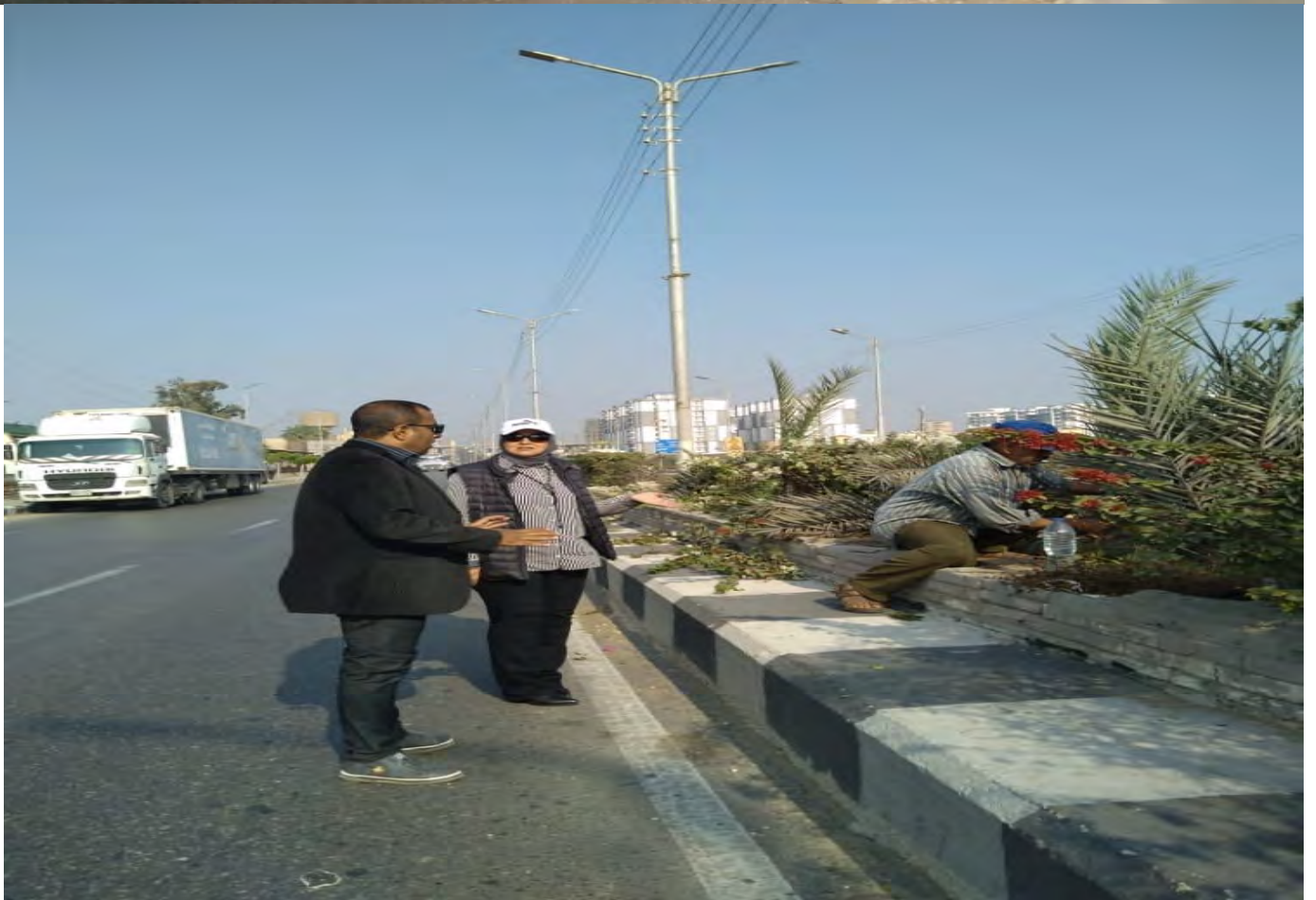
قطاع المرور الميداني